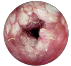
Entzündung des äußeren Gehörgangs (Otitis externa)